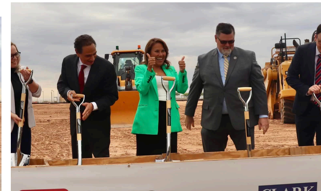
Arriba: La congresista Escobar celebra durante la ceremonia.